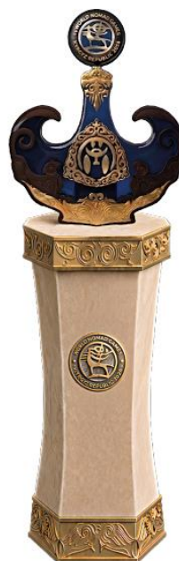
ДИЗАЙН АТРИБУТИКИ ПРОЕКТА «БИРИМДИК КЕРБЕНИ»

Изделие обеспечивает устойчивую, безопасную и эстетичную фиксацию национального сосуда в рамках официальных и культурных мероприятий.