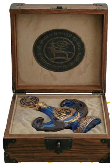
ДИЗАЙН АТРИБУТИКИ ПРОЕКТА «БИРИМДИК КЕРБЕНИ»

Таким образом, транспортировочная коробка становится не просто упаковкой, а частью символического ритуала, соединяющей бережное отношение к ценному сосуду с эстетикой официальной церемонии и уважением к