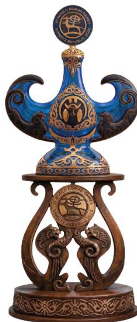
ДИЗАЙН АТТРИБУТИКИ ПРОЕКТА «БИРИМДИК КЕРБЕНИ»

Изделие обеспечивает устойчивую, безопасную и эстетичную фиксацию национального сосуда в рамках официальных и культурных мероприятий.